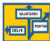
ROAD JUNCTION APPROACH

(Yellow Back Ground 60cm Dia Board Black Band)