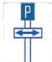
PARKING BOTH SIDE