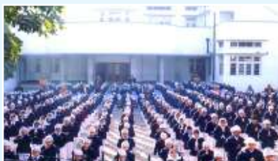
BUDS CHARM Mata Kaulan Marg, Amritsar