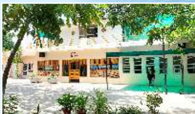
SSSS COLLEGE OF COMMERCE FOR WOMEN (Affiliated to GNDU) Mall Road, Amritsar