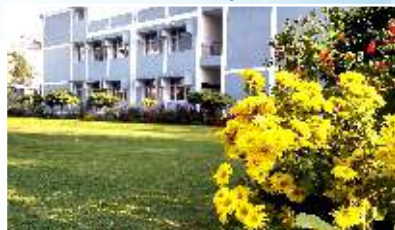
MODERN HIGH SCHOOL Unit-II (Affiliated to CBSE) Mata Kaulan Marg, Amritsar