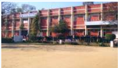
MODERN HIGH SCHOOL Gunowal Road, Jandiala Guru