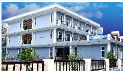
SSSS COLLEGE OF Commerce and Allied Studies Batala Road, Amritsar