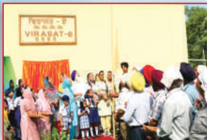
Virasat-e-SSSS, Heritage Hut