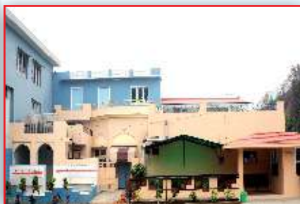
Rose Villa, Seminar Hall