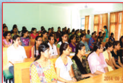
Lafani, Conference Hall