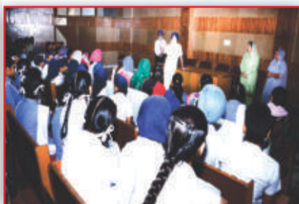
Nyamat, Meeting Room