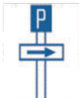
PARKING THIS SIDE

Could be amplified with a definition plate for time during which parking is allowed and with a direction sign in which parking is allowed Blue Back Ground 60cm Square