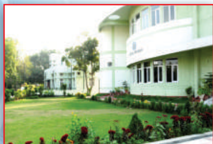
Vidyak Bhavan, Auditorium