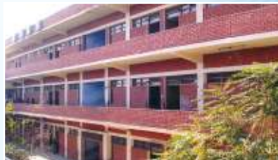
MODERN HIGH SCHOOL Tarn Taran