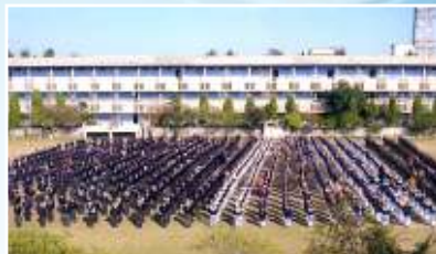
MODERN HIGH SCHOOL Unit-I (Affiliated to CBSE) Mata Kaulan Marg, Amritsar