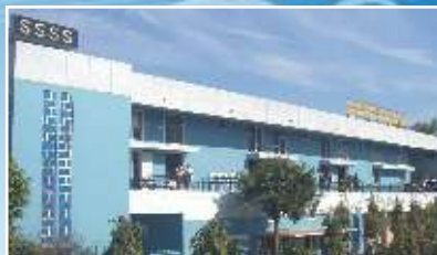
SSSS KHALSA SR. SEC. SCHOOL Mall Road, Amritsar