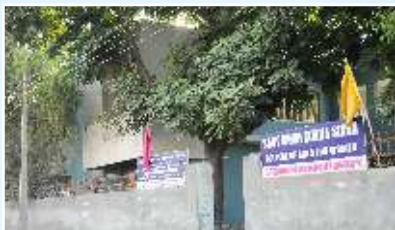
SSSS COLLEGE OF ARTS FOR WOMEN (GNDU) Mehta Road, Amritsar